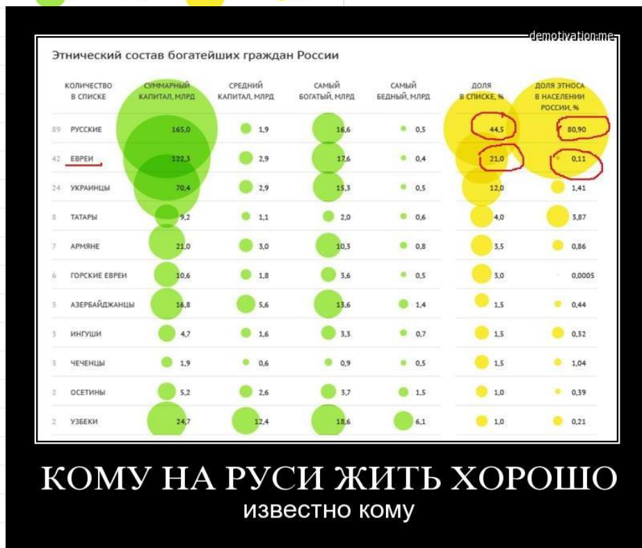
Рис. 2. Слева оригинальная картинка с сайта http://lenta.ru/articles/2014/10/27/reachethnic/ . Это одна из иллюстраций к статье «Кому на Руси жить хорошо?» (Проект «Ленты.ру» по изучению элиты — этнический состав богатейших граждан России).

Справа на переднем плане — взятый из интернета фрагмент той же картинке, но после прохождения интеллектуальной обработки в процессе социальной психодинамики: ответ на вопрос «кому хорошо жить и за счёт кого?» — дан: соответствующие социальные группы обведены красным.