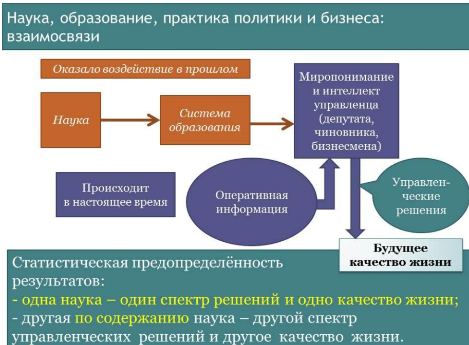
Рис. 1. Обусловленность спектра управленческих решений и будущего качества жизни наукой и системой образования

Однако, утратив государственную власть, либерал-буржуины в России наших дней по-прежнему сохраняют за собой контроль над социальными институтами, генерирующими и непрерывно воспроизводящими государственную власть, бизнес-власть и «4-ю власть» (власть СМИ над умами толпы) во всех толпо-«элитарных» обществах.