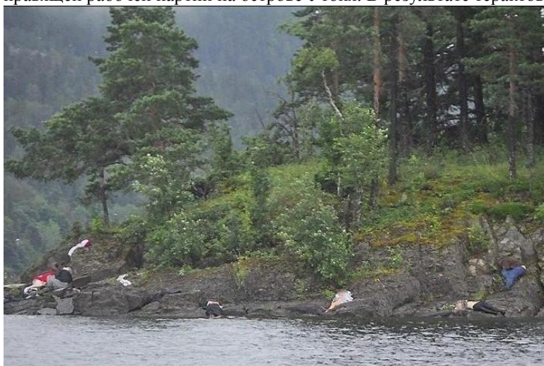
Берег острова Утойя. Трупы у уреза воды.

В Норвегии политики по поводу краха мультикультурализма не делали официальных заявлений, но 22 июля 2011 г. член масонской ложи святого Олафа Андерс Беринг Брейвик (обладатель 7-й степени посвящения — «Рыцарь Востока», входил в верховный капитул ложи; после теракта «братаны» заявили об исключении Брейвика из ложи) устроил взрыв в правительственном квартале Осло и открыл стрельбу в молодёжном лагере правящей рабочей партии на острове Утойя. В результате терактов погибло 77 человек.