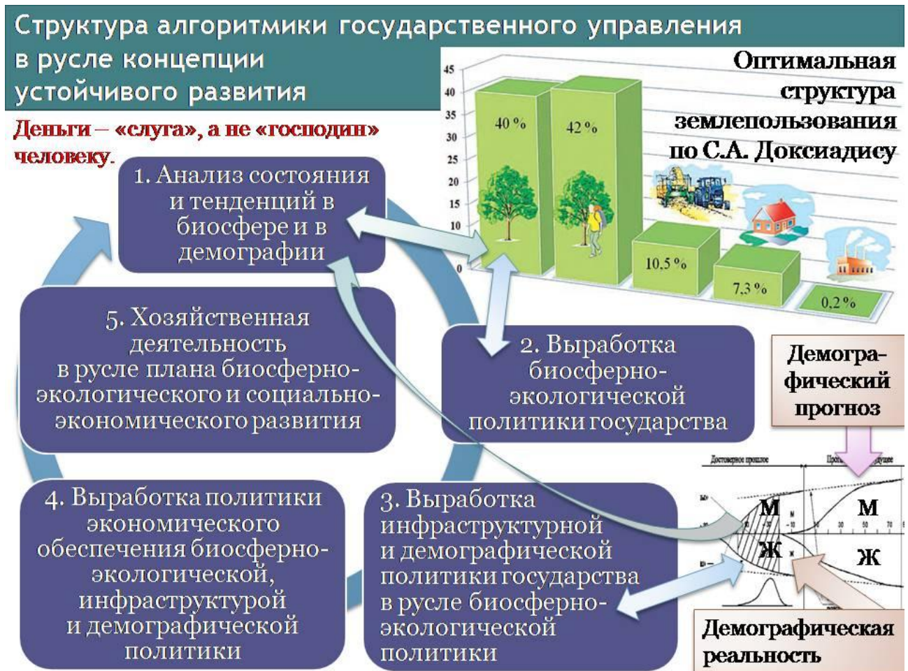
Рис. 1. Взаимная обусловленность частных управленческих задач в ходе реализации концепции устойчивого развития.

С помощью такой шкалы можно охарактеризовать в целях обеспечения биосферно-экологической безопасности общества любой регион планеты, площадь которого достаточно велика, чтобы на ней можно было выделить «кванты» хотя бы некоторых из типов ландшафтов, предусмотренных классификацией С.А. Доксиадиса.