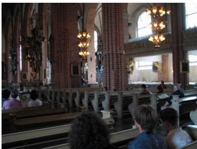
Фото 1. Храм св. Николая (Стокгольм)

матся вверх по великолепной лестнице, ведущей к фасаду церкви и лавировать между людьми, сидящими на ступеньках, поющими, играющими, пьющими различные напитки или просто глядящими на панораму вечернего Парижа.