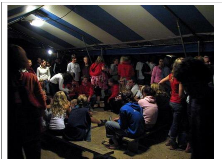
Фото 12. Айяк

Везде виден высокий уровень организации встреч и многолетний опыт братьев по работе с многотысячными группами.