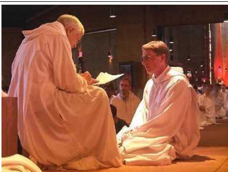
Фото 13. Посвящение в монахи

Брат прибыл в Санкт-Петербург 4.10.2006. В 16.30 посетил Вальдорфскую школу, учителя которой организовывали поездку в Тэзе. Время было не совсем удобное, поэтому пришло на встречу не более 11 человек. Все были рады встретиться вновь после поездки. Видно, что и брат был рад встречи. Это приятный человек, знающий несколько языков, умеющий вести