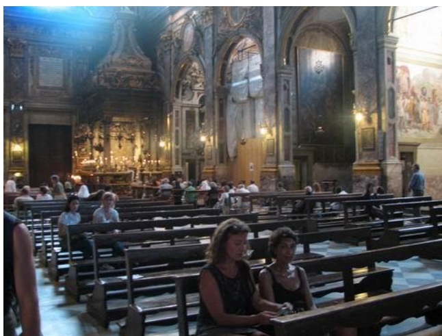
Фото 2. Вечерняя служба (Флоренция)