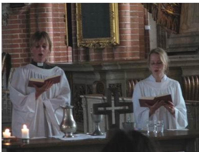
Фото 3. Храм св. Николая (Стокгольм, дневная служба)

Во время вечерней службы храм наполняется не только туристами и прихожанами, но и собравшимися со всего света паломниками, для которых интересен сам обряд поклонения Христу. Вечерняя служба в базилике мало, чем отличается от подобных католических обрядов в других церквях, по крайней мере, на первый взгляд. Чернокожий священник, читающий молитву 5 августа 2006 года, был похож на партийного деятеля, призывающего голосовать за свою партию. Толпы туристов входили в храм в одни ворота и, чуть послушав проповедь, быстро выходили в другие.